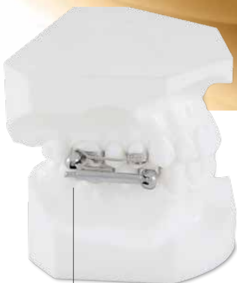
Set Herbst IV (REF 607-115-00) sur bagues