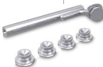
Tube télescopique avec articulation sphéroïde (REF 607-125-00)