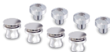
Vis à six pans creux pour Herbst I / Herbst TS (REF 607-122-30)