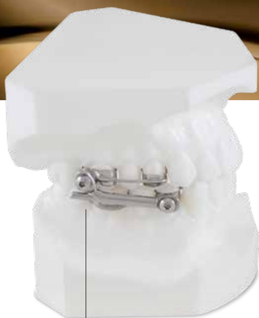
Set Herbst I (REF 607-120-00) sur bagues