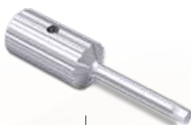
Clé pour vis à six pans creux pour Herbst I / II / TS qui permet de traiter facilement le patient (REF 607-144-00)