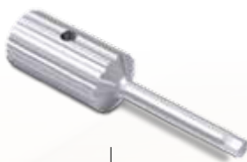
Llave hexagonal interior para Herbst I / II / TS que facilita el trabajo en la boca del paciente. (REF 607-144-00)