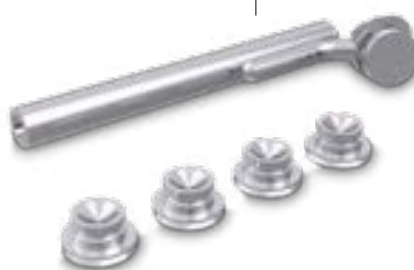
Tubo telescópico con articulación esférica (REF 607-125-00)