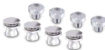
Casquillos F (forma cóncava) para Herbst I / Herbst TS (REF 607-127-30)