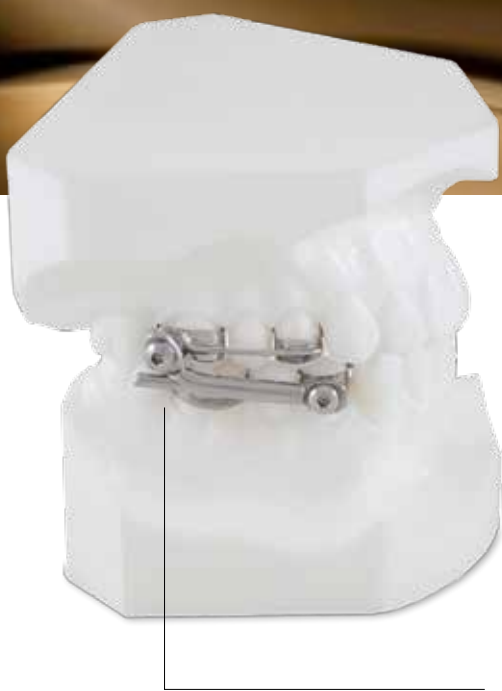
Set Herbst I (REF 607-120-00) sobre bandas