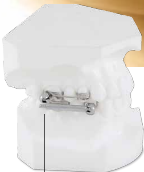
Set Herbst IV (REF 607-115-00) sobre bandas