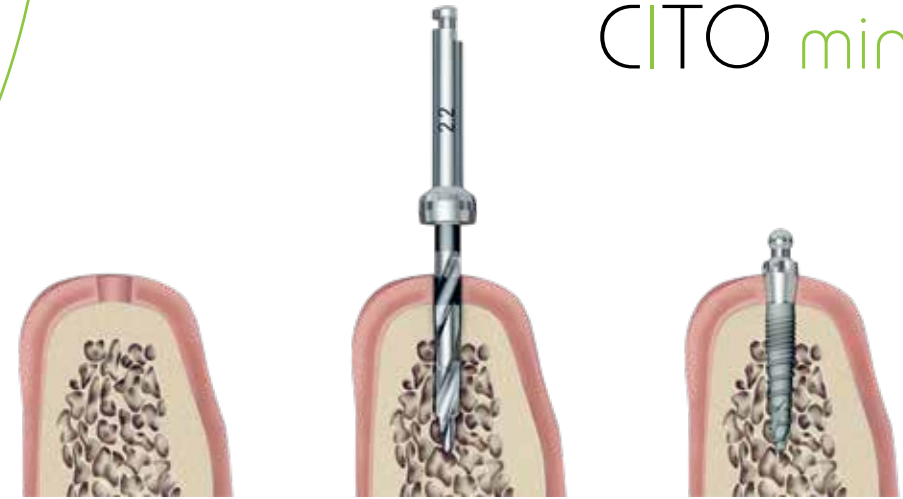
Calidad ósea blanda