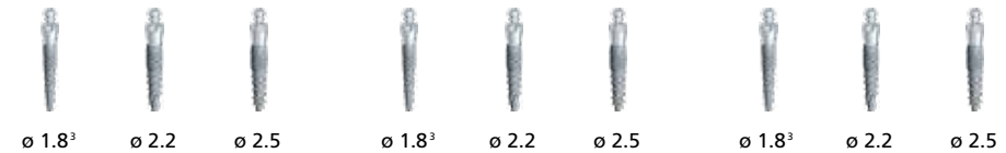
Calidad ósea dura