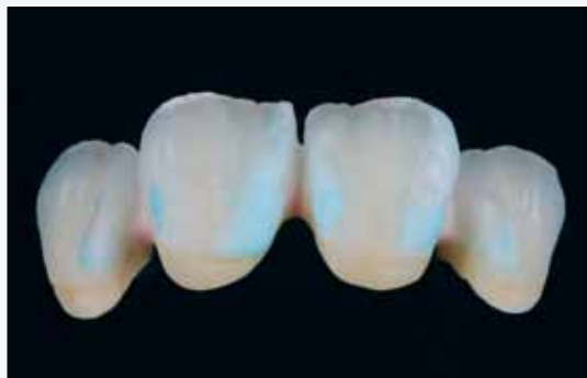
capa de masas TU de dentina/incisal, mezcladas con Modelling Liquid