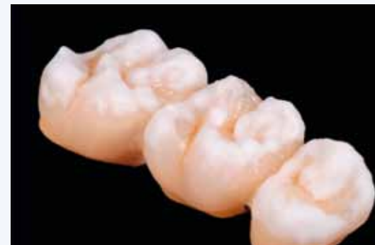
capa de Touch Up para conseguir oclusión faltante