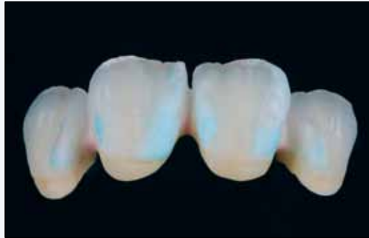
Auftrag von TU Massen Dentin/Schneide, angemischt mit Modelling Liquid