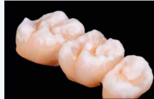
Auftrag Touch Up für fehlende Okklusion