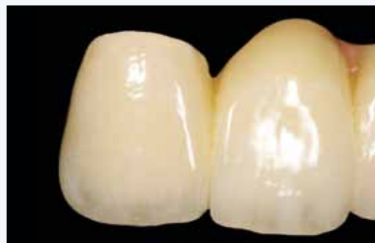
Finished restoration after the glaze firing

Note: Restorations that have been worn intraorally must be dried out in the preheat furnace. Clean the restoration, the surface must be roughened or sandblasted. Heat up the restoration in the preheating furnace from room temperature to 600 °C / 1112 °F at a rate of 5 °C / 41 °F/min. After a holding time of 2-4 hours, remove the object immediately from the furnace.