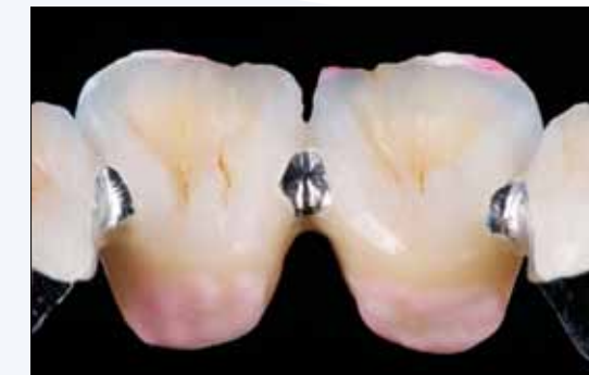
Adding to the fitting surface

Note: Adjustments can be made with or without glaze material. When using glaze material, first cover the entire surface with glaze material, stain the restoration and then apply Touch Up material over the glaze material and staining.