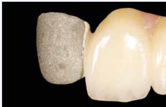
preparar la estructura

□ reparación de un trabajo llevado en boca