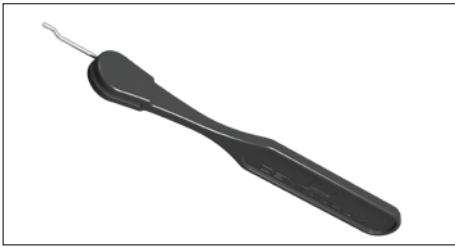
Fig. 10 Sicherheitsschlüssel, Safety key, Clé de sûreté, Llave de seguridad, Chiavetta di sicurezza REF 611-120-01