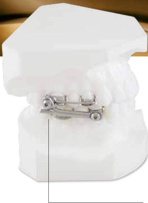
Herbst I Set (REF 607-120-00) auf Bändern