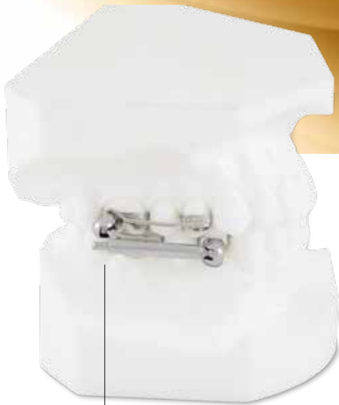
Herbst IV Set (REF 607-115-00) auf Bändern