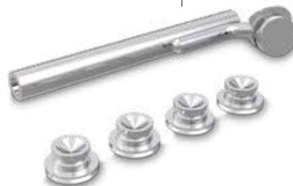
Teleskoprohr mit Kugelgelenk (REF 607-125-00)