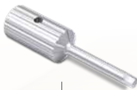
Innensechskantschlüssel für Herbst I / II / TS ermöglicht einfaches Arbeiten am Patienten. (REF 607-144-00)