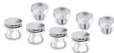
F-Sockel (konkave Form) für Herbst I / Herbst TS (REF 607-127-30)