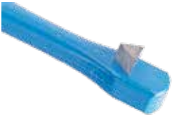
Molarenbandaufsetzer Kunststoff sterilisierbar bis Max. 180 °C Mit geriffelter Dreikant-Hartmetallspitze.