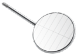
Mundspiegel mit Hilfslinien (ohne Griff), lingual sterilisierbar