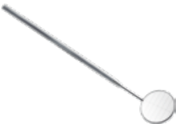
Mundspiegel mit Hilfslinien (montiert), lingual sterilisierbar