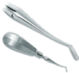
Bandandrücker nach Mershon sterilisierbar Mit geriffelter Vierkantspitze und anatomischem Griff für gute Kraftübertragung beim Bandsetzen.